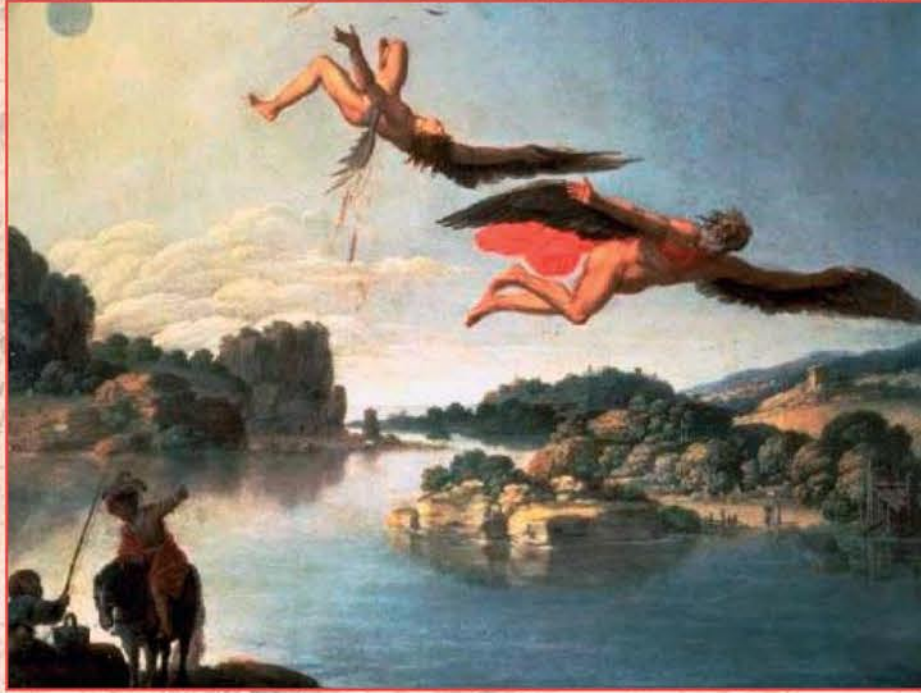
Chute d'Icare par SARACENI Gallerie Nazionali di Capodimonte, Naples