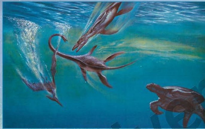
Reconstitution d'un paysage marin du Mésozoïque

Les fleurs fossilisées sont très rares ! Cependant, un gisement a été découvert en 1981 en Suède. Des fleurs de 2 mm. étaient tombées dans la vase et leurs trois dimensions furent ainsi préservées par la fossilisation. Le magnolia est une des plantes à fleurs les plus primitives. D'ailleurs, les reconstitutions de paysages de la fin du Mésozoïque, représentent souvent les derniers dinosaures herbivores (triceratops) broutant des magnolias en fleurs.