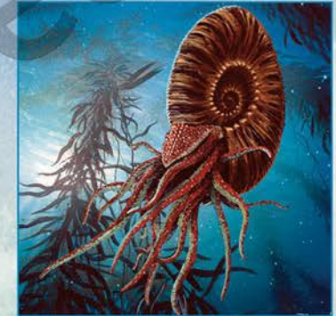
Reconstitution d'une ammonite.

Les plus anciens datent de - 220 Ma environ. Les scientifiques ont longtemps cru que les mammifères du Mésozoïque étaient de petite taille, insectivores et probablement nocturnes. Pourtant, en 2005, l'hypothèse de cette « faible » diversité morphologique et écologique est bouleversée par la découverte du fossile Repenomamus giganticus : environ 1 m. pour 12 kg., il était un prédateur de petits dinosaures herbivores.