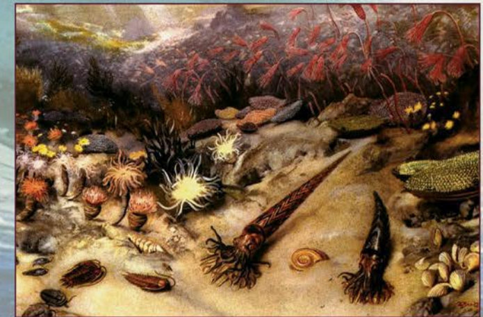
Reconstitution d'un fond marin du Paléozoïque (trilobites, orthoceras, crinoïdes, etc.)

Cette période commence avec la diversification des invertébrés marins et des poissons. Certaines espèces de poissons ont lentement évolué. Elles sont à l'origine de tous les autres vertébrés.