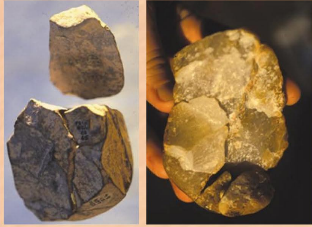
Les premiers outils retrouvés dédiés à la découpe de la viande.