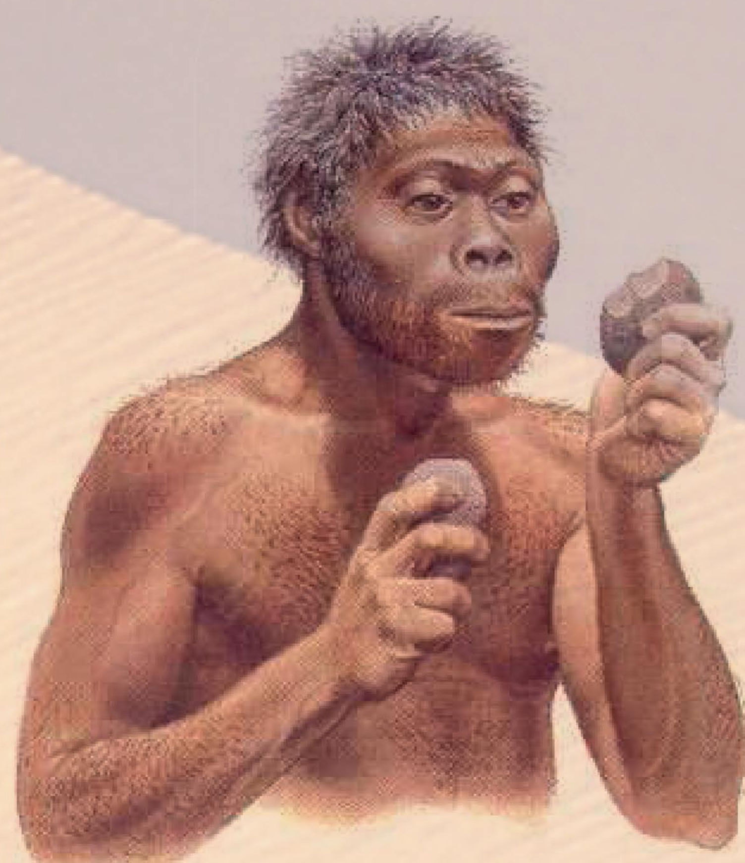
Homo habilis : les débuts de la pierre taillée et de l'industrie lithique

C'est la culture sur galet ou "pebble-culture". Les campements de l'Oldowayen sont le plus fréquemment installés près d'un fleuve et donc près de la matière première : le galet.