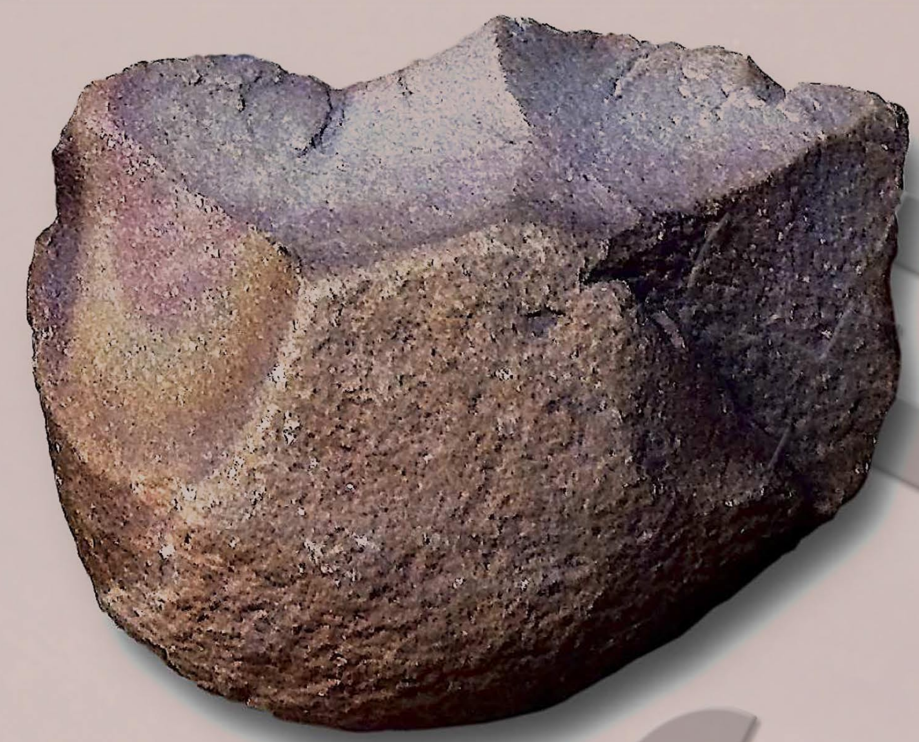
Galet aménagé ou chopper retrouvé en Afrique de l'est (Ethiopie, Tanzanie)